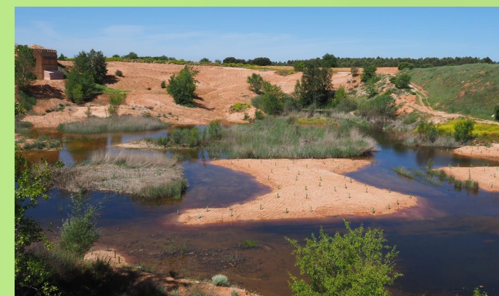
Humedal de La Chanta con islas y orillas acondicionadas para anfibios y otros grupos faunísticos (2021)