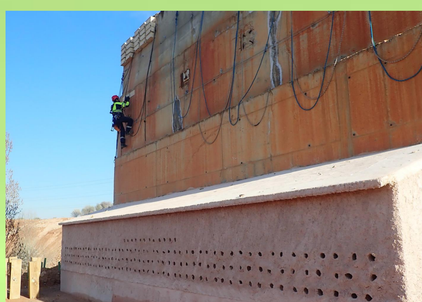
Colonia artificial para avión zapador (parte inferior). En el antiguo muro de la machacadora (parte superior) se han colocado nidos y refugios para especies coloniales como vencejo, avión común, cernícalo primilla y murciélagos