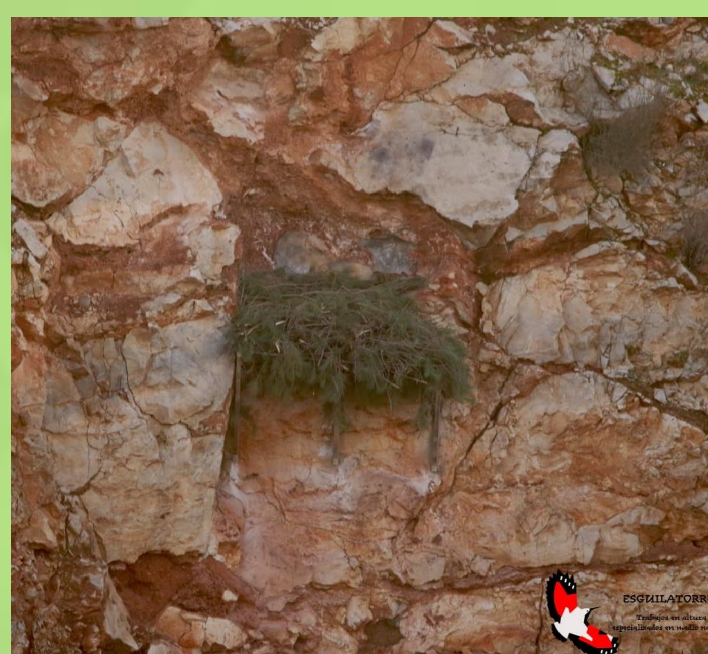
Nido artificial para águila real, construido en talud rocoso vertical