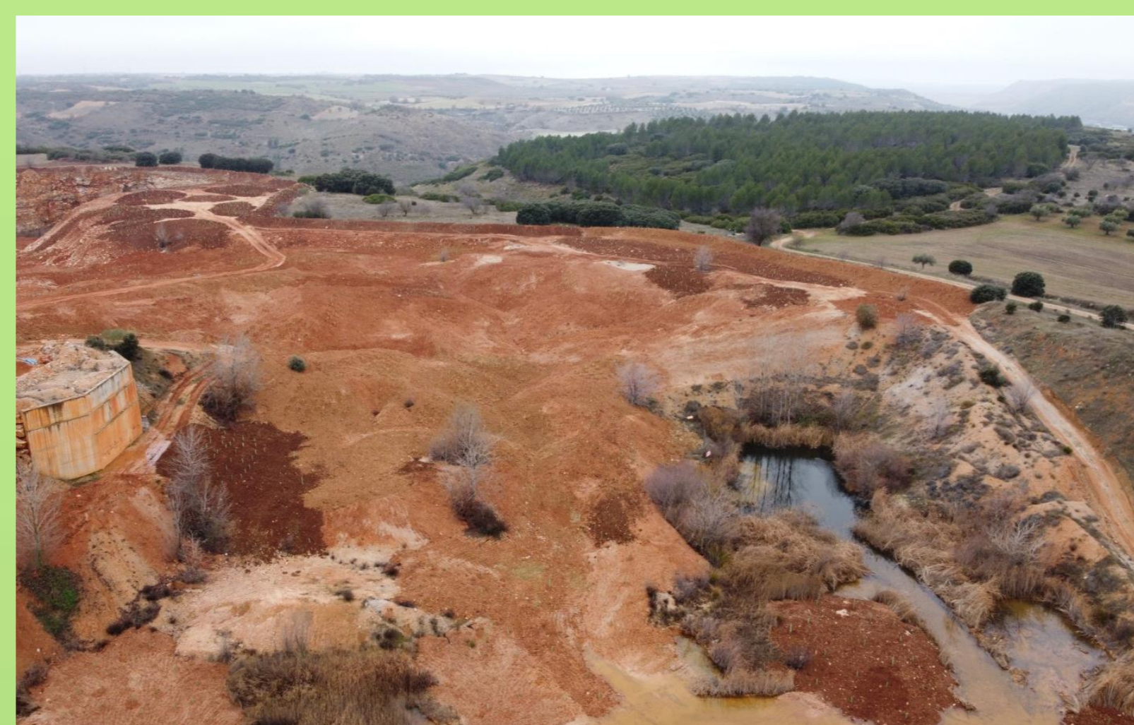
Fomento de un mosaico de hábitats durante la restauración morfológica (2020)

Se desarrollarán cursos y talleres destinados a público general o especializado en conservación, en colaboración con otras entidades, como administración, universidades, etc.